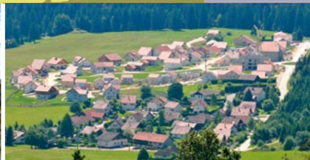
Les Hauts de la Baigne aux Oiseaux - Morteau