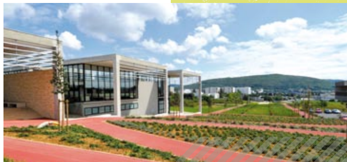
Bibliothèque universitaire de Médecine et Pharmacie - Besançon