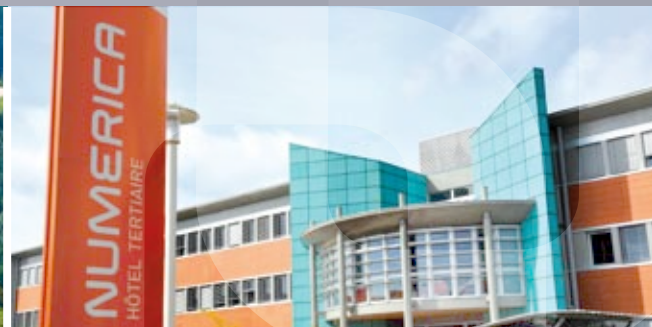
Numerica - Montbéliard